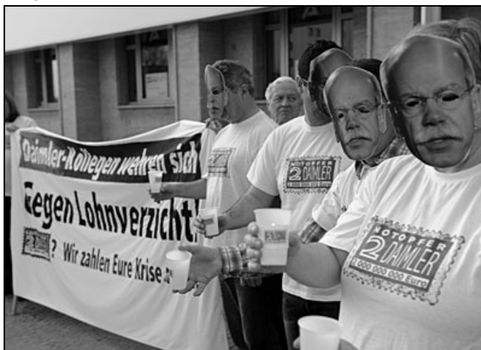
Daimler-Kollegen fordern am Haupteingang der Aktionärsversammlung mit Zetsche - Masken das 2 Milliarden- Notopfer bei den Aktionären ein: „Die Reichen sollen ihre Krise selber zahlen!“

◆ Keine Reduzierung der Aufzahlung zur Kurzarbeit, kein Verzicht bei Einmalzahlungen